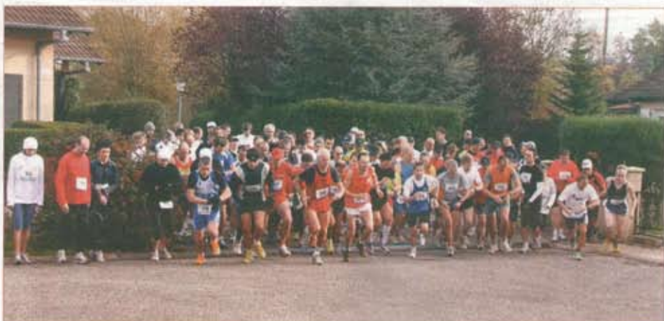
10 heures : c'est le départ, les coureurs sont lâchés pour 10 km.