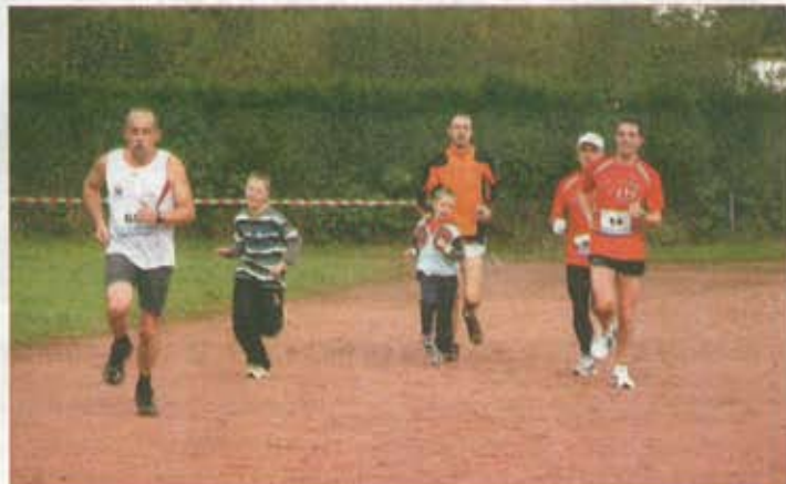
La relève est assurée.